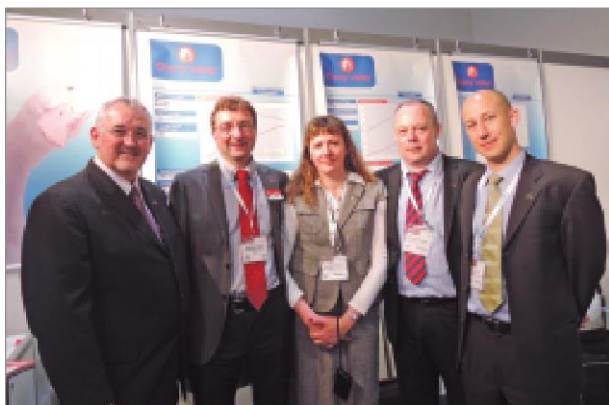
Коллектив «Черри Вэлли» (Великобритания)

Общее впечатление участников делегации, визит которой инициировала компания «Асти Групп», — высокий уровень организации VIV Europe-2014, большое количество инноваций, насыщенная деловая программа, возможность посещения ферм и других аграрных предприятий. И конечно же, неотъемлемая часть программы — вечерние прогулки по улицам весеннего Амстердама