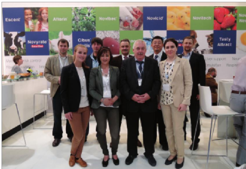
Команда «Инновада» (Бельгия)