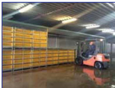
Поднятие и перевозка ящиков вилочным погрузчиком