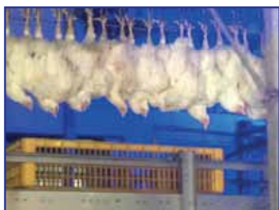
Навеска птицы из ящиков

каждой птицефабрики со скоростью работы линии от 6 000 голов бройлеров в час и выше. При навеске птицы из ящиков значительно