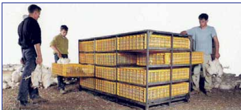
Двусторонняя загрузка и выгрузка птицы

Модульная конструкция позволяет легко задвигать и выдвигать ящики