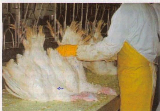
Рис. 2. Наилучшее решение для подачи индейки на линию убоя: оператор просто помещает ноги оглушенной птицы в петли линии навески